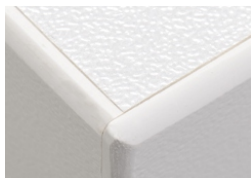
Kunstharzbelag grau mit Dickkanten