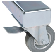
Lenkrollen 100 mm. spurlos mit Bremse